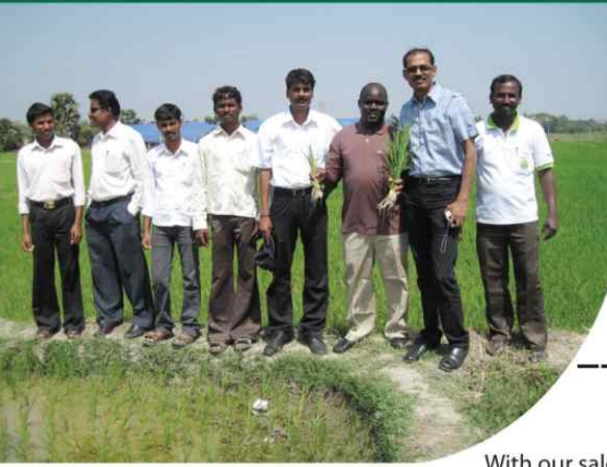
With our sales team